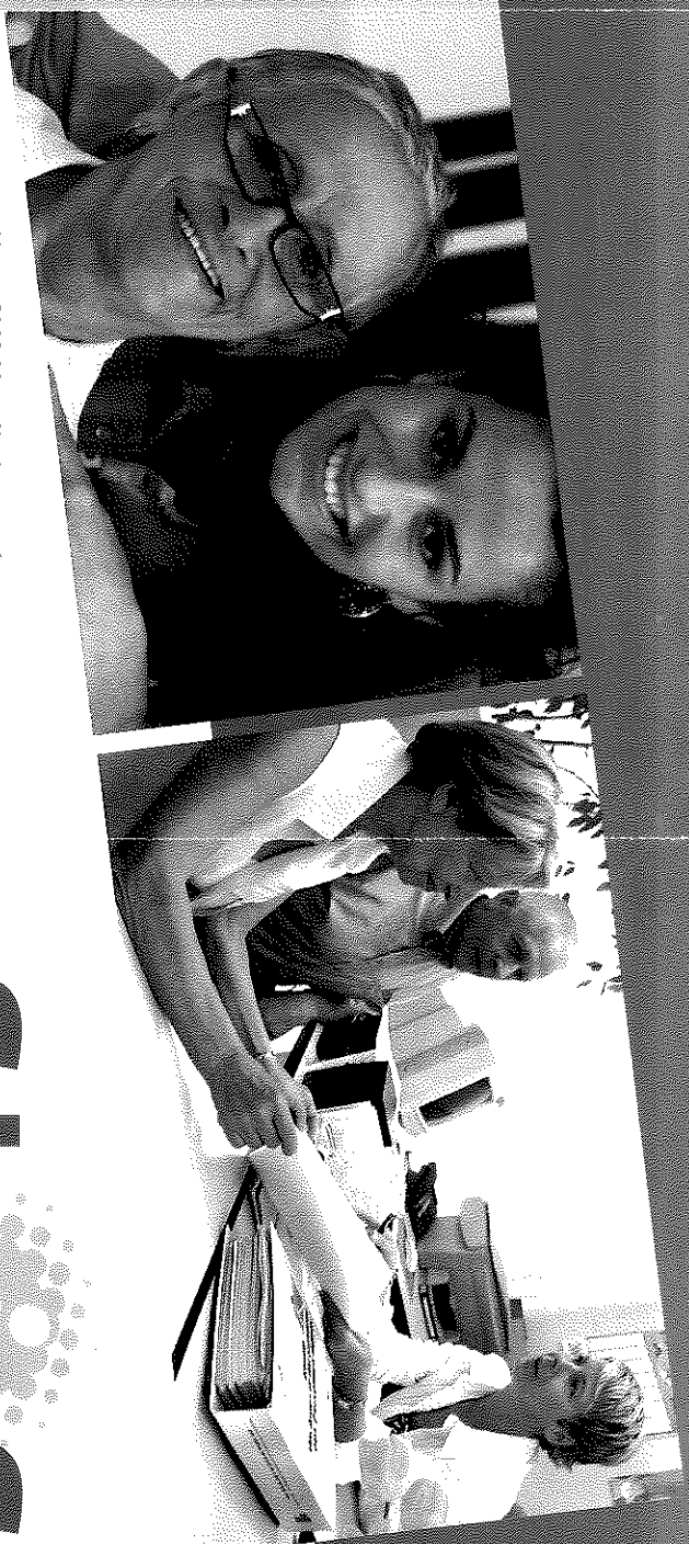
Votre CLIC Moselle à votre écoute

Maison du Département Espace Cormontaigne 1, avenue Gabriel Lippmann 57970 YUTZ Tél. 03 87 37 95 66 • Fax 03 87 37 95 39 climosellethionvilleyutz@cg57.fr